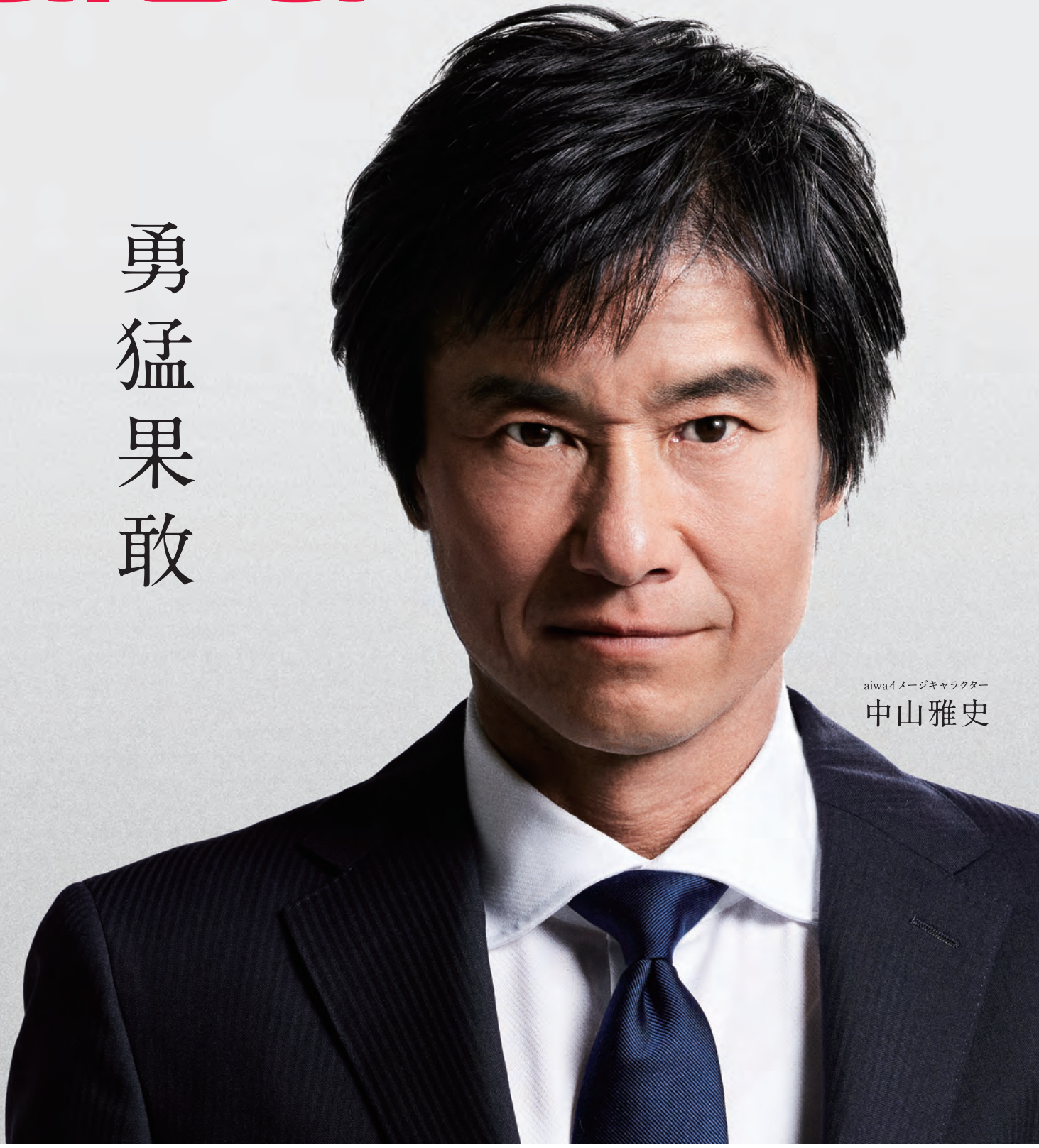
aiwaイメージキャラクター 中山雅史

※すべてのデータは当社測定条件によります。都合により記載内容を予告なしに変更することがあります。※ファイルの種類/記録データ/設定/サイズ/形式/記録状態などによっては、操作や再生ができない場合があります。※本製品でネットワーク機能を使用する場合、別途インターネット回線契約が必要です。※Google、Google Chrome、ChromeOS、ChromebookおよびGoogle PlayはGoogle LLCの商標です。※Bluetoothは米国内におけるBluetooth SIG Inc.の登録商標または商標です。※Intelはアメリカ合衆国およびその他の国におけるIntel Corporationまたはその子会社の商標または登録商標です。※aiwaおよびaiwaロゴはアイワ株式会社の登録商標です。※そのほか、記載の会社名および商品・サービス名は各社の登録商標または商標です。※コンテンツによってはダウンロードできないものもあります。※メディアの種類/記録データ/設定/サイズ/形式/記録状態などによっては、操作・再生などできない場合があります。※microSDカードは別売となります。※SDXCの転送速度は、SDHCの転送速度と同等となります。※寸法および重量は自社試験によるデータであり、実際の結果は異なる場合があります。※本カタログに使用している画像はイメージです。© aiwa marketing japan