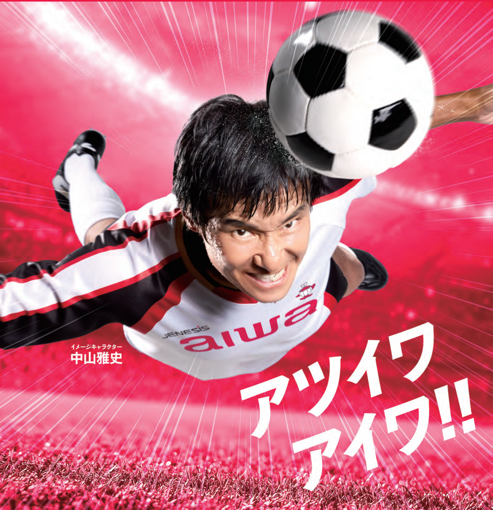
イメージキャラクター 中山雅史